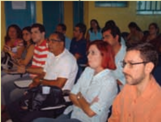
Secretaria de Saúde de Palmares.