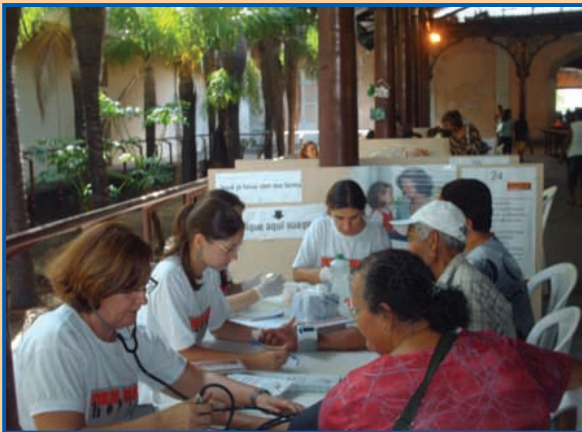
CRF-PE - Semana da Cidadania Metrorec

Informativo Oficial do Conselho Regional de Farmácia do Estado de Pernambuco - Ano IX – Maio - Agosto/2008