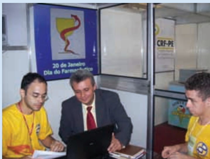
Informações jurídicas sobre a profissão fornecidas no stand do CRF-PE