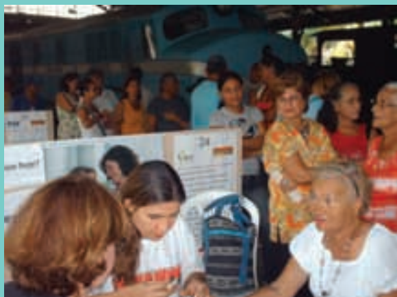
CRF-PE na Semana da Cidadania Metrorec