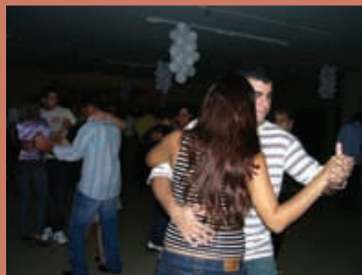
Farmacêuticos comemoram São João

O Conselho de Farmácia agradece a participação e a solidariedade de todos.