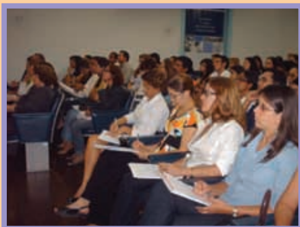
Simpósio de Farmacovigilância