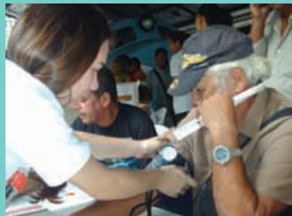
CRF-PE na Semana da Cidadania Metrorec