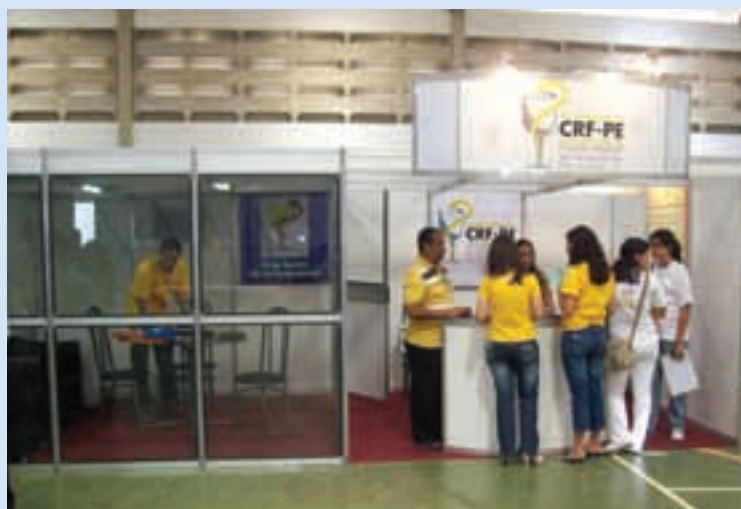
Stand do CRF-PE

No dia que antecedeu o evento, aconteceu, no Supremo Tribunal Federal (STF), o julgamento de ação de inconstitucionalidade do artigo 5º da Lei de Biossegurança, que autoriza as pesquisas com células-tronco embrionárias.