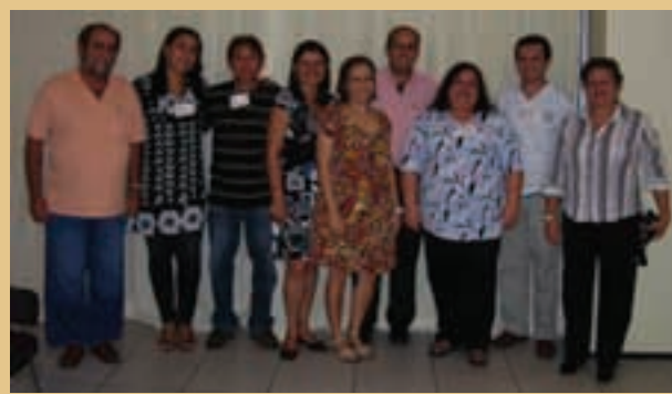
Presidentes e Diretores dos CRF's do NE.