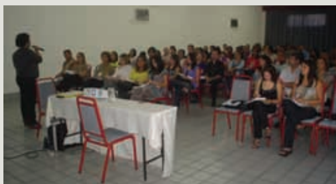
Auditório do Caruaru Park Hotel