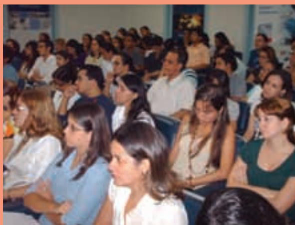
Auditório Memorial da Medicina de Pernambuco

Como resultado deste encontro, foi definido para o próximo dia 11 de setembro, uma capacitação em Farmácia Notificadora para farmacêuticos. O curso de duração de 8 horas será ministrado pela ANVISA.